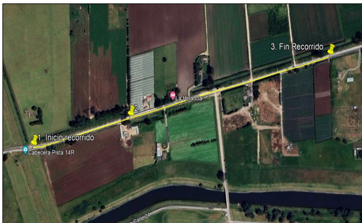
Ilustración 1. Recorrido verificación ambiental -Vereda La Florida

Se realizó recorrido de control y vigilancia de los componentes ambientales en áreas rurales del municipio de Funza, vereda La Florida, el día 20 de junio de 2024, desde las coordenadas 4°42'51.126"N - 74°10'24.26"W hasta las coordenadas 4°43'15.104"N - 74°10'0.649"W (ver ilustración 1. Ruta amarilla), con el fin de verificar las condiciones ambientales, identificar posibles afectaciones a los recursos naturales y realizar las acciones de prevención correspondientes.